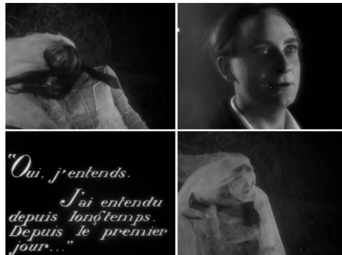
Fig. XI : Jean Epstein, La Chute de la maison Usher (1928)

Dans La Chute de la maison Usher d'Epstein [Fig. XI], quand sa femme sort de la tombe, Roderick – nous la voyons, pas lui : il est assis dans la grande salle de son manoir – s'exclame par l'écriture de l'intertitre : « Oui, j'entends. J'ai entendu depuis longtemps. Depuis le premier jour... » C'est-à-dire depuis la première fois, depuis l'événement. J'entends depuis le fantôme.