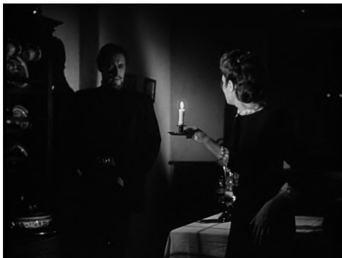
Fig. XII : J.L. Mankiewicz, L'Aventure de Mme Muir ( The Ghost and Mrs. Muir , 1947)

On peut la voir d'abord descendre l'escalier de la grande demeure, une chandelle à la main. Elle ouvre la porte du salon et se retrouve devant le portrait de feu le capitaine Gregg dans un plan qui répète exactement – au moins pour ce qui est du tableau : c'est le principal – celui de sa découverte du tableau quelques scènes auparavant [Fig. XIII].