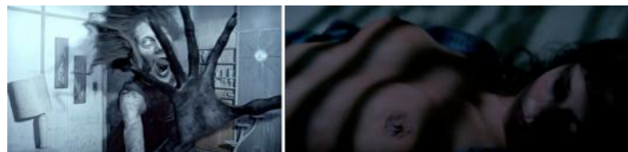
Fig. II : Andrés Muschietti, Mama (2013) / Sidney J. Furie, L'Emprise ( The Entity , 1982)

2/ La distinction entre spectre et revenant intervient également au cinéma d'une façon tout à fait antipodale et beaucoup plus paradoxale – c'est une des raisons premières, si ce n'est la raison principale, de la très grande richesse du motif. Le cinéma – au moins analogique – est génétiquement voué aux revenants