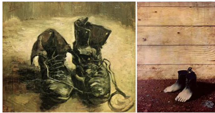
Fig. IX : Vincent Van Gogh, Vieux Souliers aux lacets , 1886 Huile sur toile, 37.5 x 45 cm, Van Gogh Museum, Amsterdam