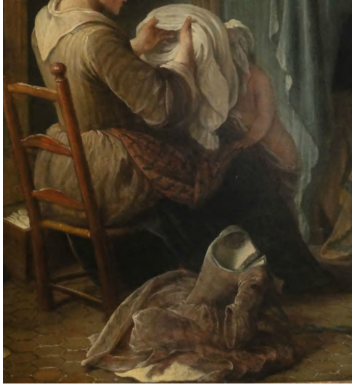
Fig. VIII : Pierre-Louis Dumesnil, Servante habillant des enfants , 1730 (détail)

Huile sur toile, dimensions non précisées, Musée Carnavalet, Paris