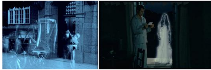
Fig. IV : Victor Sjöström, La Charrette fantôme (Körkarlen, 1921) / Manoel de Oliveira, L'Étrange Affaire Angelica (O estranho caso de Angélica, 2010)

Que le spectre ou le revenant concernent tout le cinéma, et pas seulement les films avec des fantômes (Derrida appelle cela des « greffes de spectralité [56] »), ne veut pas dire que tout revenant ou spectre à l'écran soit une image du cinéma dans le film : il faut se débarrasser du tic de voir mécaniquement du « méta-cinéma » partout. En revanche, il est vrai que les fantômes de cinéma qui me semblent les plus intéressants sont ceux qui nous disent quelque chose des puissances des percepts esthétiques spectralisantes du cinéma. L'un des plus beaux exemples se trouve à nouveau dans L'Aventure de Mme Muir au moment de la première apparition du fantôme du capitaine Gregg [Fig.V].