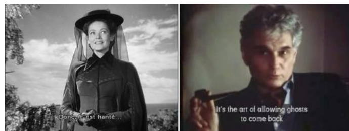
J. L. Mankiewicz, L'Aventure de Mme Muir (The Ghost and Mrs. Muir, 1947) / Ken McMullen, Ghost Dance (1983)

Toute anthologie du cinéma – et tout y passe, ou presque, par spectrologie : comédie, comédie romantique, romance, fantastique, horreur... – pointerait aussi, par un saut du circonstanciel (tel fantôme dans tel film) au définitionnel, une anagrammatique hantologie du cinéma , spectre à l'image ou pas, car le cinéma « pèse son poids de fantômes [9] ». C'est même son ancêtre, le Cinématographe, qui a largement contribué à revigorer les fantômes à une époque où la littérature ne commençait plus à les prendre trop au sérieux dans une optique plus ou moins décorative d'altération de l'imaginaire romantique (parodique : Wilde, scientifique : Verne).