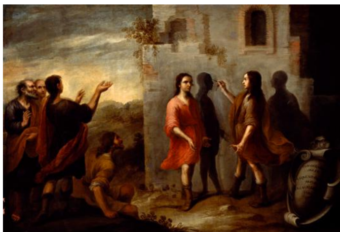
Fig. VI : Bartolomé Esteban Murillo, L'Origine de la peinture , 1660-1665

d'Arcadie raconte moins une histoire qu'il ne raconte la représentation de l'histoire dans sa double relation à l'écriture et à la mort [63] » ? Jusques aussi quelques caprices qui reviennent sans doute trop à l'œil du spectateur ( Servante habillant des enfants de Dumesnil, et cette robe qui tombe étrangement, ou plutôt ne tombe pas, semble recouvrir un corps spectral invisible assis [Fig. VIII]...), mais qui constituent aussi les tentatives les plus radicales dans l'histoire de la peinture finalement assez timide (illustrative) en matière de fantômes (et entre les deux, tant d'intermédiaires plus ou moins intéressants, mais avec toujours ce fait de peinture, à quoi qu'on ait affaire, que les figures peintes pensent « l'instabilité spécifique de la figure humaine [64] »).