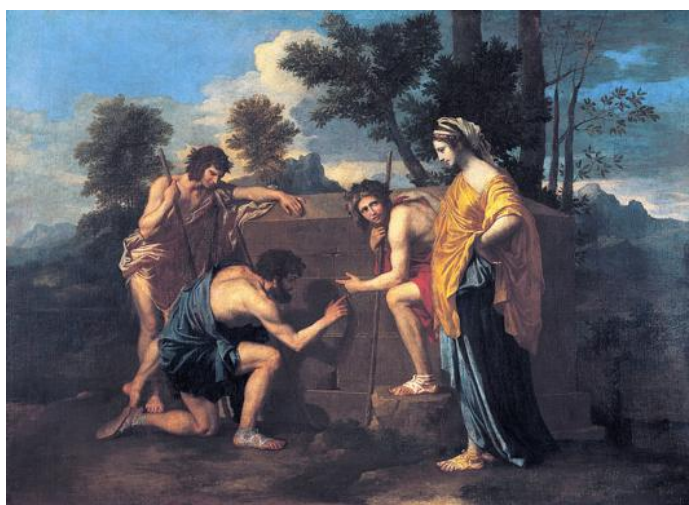
Fig. VII : Nicolas Poussin, Et in Arcadia ego , 1638-1640

Huile sur toile, 115 x 169 cm, Muzeul National de Artă al României, Bucarest