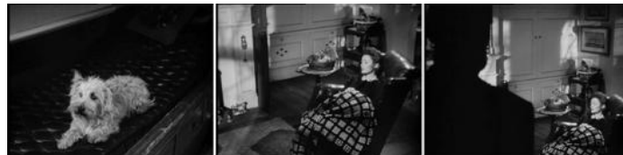
Fig. V : J.L. Mankiewicz, L'Aventure de Mme Muir (The Ghost and Mrs. Muir, 1947)

Que le spectre ou le revenant concernent tout le cinéma, et pas seulement les films avec des fantômes (Derrida appelle cela des « greffes de spectralité [56] »), ne veut pas dire que tout revenant ou spectre à l'écran soit une image du cinéma dans le film : il faut se débarrasser du tic de voir mécaniquement du « méta-cinéma » partout. En revanche, il est vrai que les fantômes de cinéma qui me semblent les plus intéressants sont ceux qui nous disent quelque chose des puissances des percepts esthétiques spectralisantes du cinéma. L'un des plus beaux exemples se trouve à nouveau dans L'Aventure de Mme Muir au moment de la première apparition du fantôme du capitaine Gregg [Fig.V].