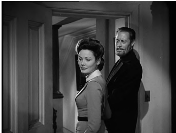
Fig. XIV : J. L. Mankiewicz, L'Aventure de Mme Muir ( The Ghost and Mrs. Muir , 1947)

La mort, seule, peut remédier , c'est-à-dire remettre de la médiation, intercéder pour nous auprès de l'autre ; nous livrer, décédés, décidés, à l'entre qu'est l'autre, à l'ancre de l'autre. Il ne s'agit pas de faire de la mort un art de vivre, de courir trop vite à la mort, mais de comprendre que nous ne pouvons vivre avec l'autre qu'à partir de nos fantômes respectifs.