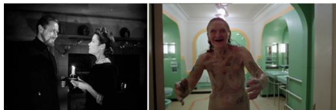
Fig. I : J.L. Mankiewicz, L'Aventure de Mme Muir ( The Ghost and Mrs. Muir , 1947) / Stanley Kubrick, Shining ( The Shining , 1980)

1/ Tout d'abord, la manière la plus lisible : d'un côté, nous avons le spectre, il y en a image, il agit malgré tout dans quelque visibilité ; d'un autre côté, nos yeux seuls ne suffisent pas à voir le revenant, où nous le voyons trop tard, quand il vient sur nous, et que voir n'est déjà plus perception adéquate. Nous : c'est-à-dire généralement à la fois le, ou la, protagoniste et le spectateur. Cette première extension est aisément intelligible. Un spectre, c'est par exemple le fantôme du capitaine Daniel Gregg dans L'Aventure de Mme Muir de Joseph L. Mankiewicz [53], dans le genre « homme tel qu'il était vivant », ou la vieille femme de Shining de Stanley Kubrick, dans le macabre [Fig. I]. En revanche, celui de Mama d'Andrés Muschietti, qui ne peut être vu, dans la fiction comme dans la salle, que grâce au flash d'un appareil photographique (à la vidéosurveillance dans Dark Water , à la caméra thermique dans Les Revenants... ), ou le fantôme invisible (caresse d'un sein) – solution limite de l'image – de L'Emprise de Sidney J. Furie, sont des revenants [Fig. II].